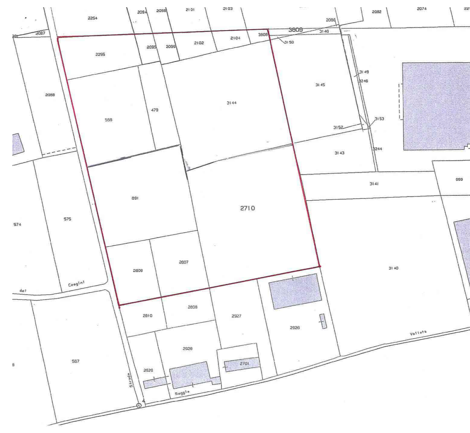
Estratto di Mappa Sc. 1 : 2000